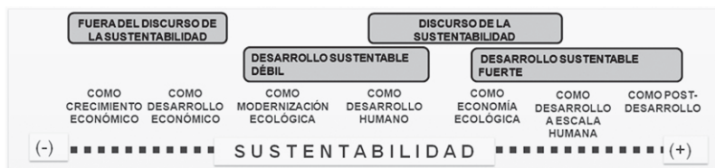
Figura 2: clasificación del concepto de desarrollo en función de la noción de sustentabilidad

A continuación, se presenta un esquema que sintetiza la tipología del par desarrollo/sustentabilidad (Figura 2).