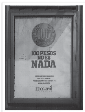
Fotografía tomada en una estación de buses en Santiago