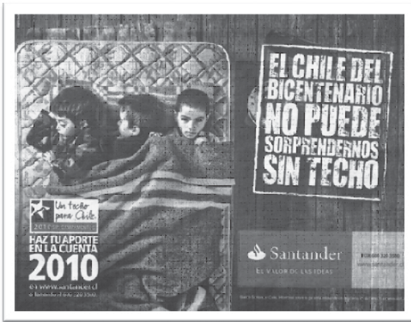
Pieza publicada en el diario La Tercera en junio de 2009

La pieza es lanzada en alianza estratégica entre Un techo para Chile y Banco Santander. Como la mayoría de las piezas, esta interpela emocionalmente: se muestran tres niños (sujetos inocentes) en condición de pobreza y hacinamiento, donde uno de ellos interpela con la mirada al espectador. En cuanto a los recursos lingüísticos la pieza utiliza tres vías para la construcción de su “gran causa”: i) el nombre emblemático y nacionalista de la fundación “Un techo para Chile”, ii) una meta ambiciosa y magna como emblema de campaña “2010 sin campamentos” y iii) la sentencia moralmente imperativa “El Chile del Bicentenario no puede sorprendernos sin techo”. Contrasta con la magnitud e importancia de esta gran causa la simplicidad de la ayuda solicitada: “Haz tu aporte en la cuenta 2010 en www.santander.cl o llamando al 600 320 3500”. Así, realizar una donación con una simple llamada telefónica o vía Web es significada como ayudar a construir un país sin campamentos. De tal forma, suele darse en la publicidad sobre solidaridad esta relación entre solicitar una ayuda fácil y de bajo costo que, sin embargo, permite al donante vincularse a una gran causa solidaria.