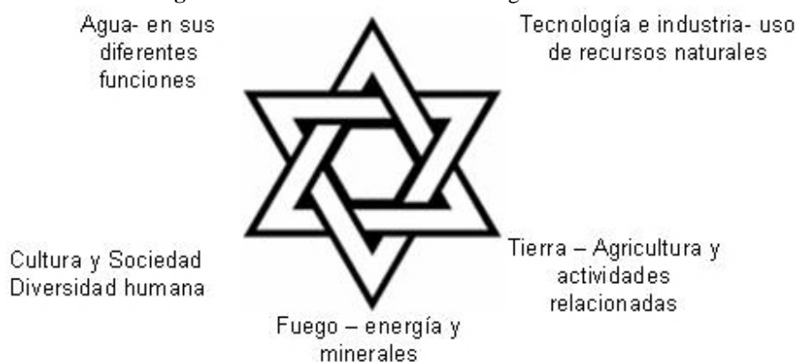
Figura 1: Elementos de la CIA-Sur según la Estrella de David.

En una somera revisión de seis ejes diagnóstico (I- Aire, II- Tierra, III- Fuego, IV- Agua, V- Cultura y sociedad y VI- Tecnología e industria; Fig. 1) vimos que las respuestas de la sociedad costarricense a los problemas socio-ambientales que vivimos son incorrectas. Por ejemplo, aunque haya habido una pequeña recuperación de bosques en ciertos sectores del país desde fines de los 1990s, ésta ha ocurrido bajo condiciones que implican el surgimiento de otros problemas (Fig. 2). Es notable la reforestación con maderables no nativos y gran parte del pequeño aumento boscoso ha ocurrido bajo un sistema mixto o privado de protección para el turismo y/o liado al pago de servicios ambientales -que, de 1995 al 2004, aumentó la tenencia de tierras privadas de 10.000 a 500.000 hectáreas (elaboración propia). La exclusión por privatización con brechas socio-económicas podría generar que bajo escenarios de crisis petrolera, aun los conservacionistas excluidos no toleraran más y usaran sin reparo los recursos, aunque éstos estén protegidos o tengan dueño, sino otro necesitado igual lo haría.