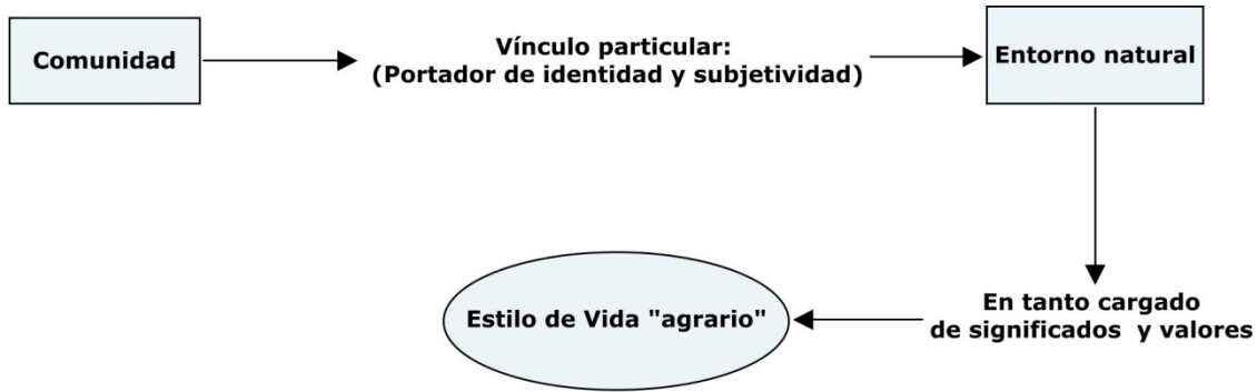
Figura 2. Vínculo con el entorno y estilo de vida agrario.

los estudios de Pegg (citado en Urkidi, 2008), donde se señala que las zonas mineras tienen comparativamente mayores niveles de prostitución, alcoholismo, enfermedades como el SIDA e inequidad social.