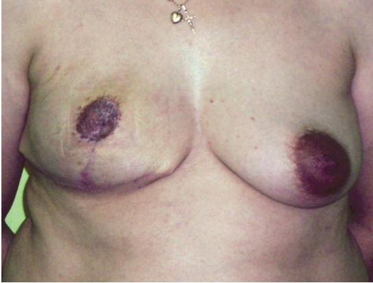
Figura 3. Resultados a los 6 meses