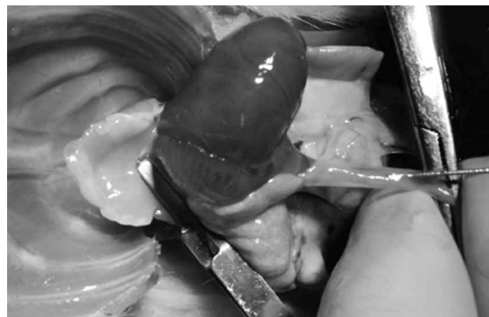
Figura 1. Clamp sobre vena cava superior e infusión de suero frío más heparina por vena cava inferior.

vertical a lo largo de la línea media desde el xifoides hasta el pubis y se emplearon retractores metálicos para separar la pared abdominal. El intestino fue rechazado hacia la derecha. Se accedió a los grandes vasos abdominales mediante disección roma y luego se seccionaron. Inmediatamente después, se realizó una incisión en mariposa del tórax hasta exponer sus órganos sobre la bifurcación aórtica. Se instaló un clip metálico en la vena cava superior y en la vena cava inferior justo sobre el diafragma para infundir 10 cc de solución fisiológica a 4°C con 600 U de heparina, logrando detener los latidos cardíacos (Figura 1). Luego se identificó bajo microscopio la arteria pulmonar y la aorta, separándolas del tejido conectivo para luego seccionarlas, permitiendo una longitud adecuada para la anastomosis.