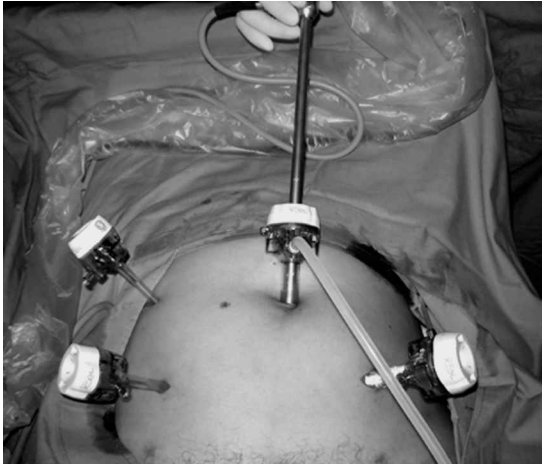
Figura 1. Posición de los trocacos.