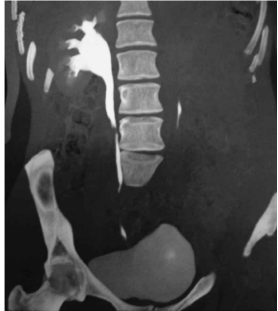
Figura 5. Uro-TAC que muestra indemnidad ureteral en un flap de Boari derecho.

En todos los pacientes se logró completar la cirugía sin necesidad de conversión a cirugía abierta. El tiempo operatorio promedio fue 150,7 minutos (rango 90 a 240). El sangrado promedio durante la operación fue 63 ml (rango 0 a 200). La estadía hospitalaria promedio fue 4,4 días (rango 2 a 7). En un paciente fue necesario mantener la sonda vesical por 7 días por filtración de orina persistente por el drenaje. Un paciente debió ser reoperado en forma laparoscópica para reparar parte de la cistorrafia que filtró resultando en un uroperitoneo. Todos los pacientes han sido controlados con pielografía de eliminación y/o tomografía computada (Figura 5). Con un seguimiento promedio de 25 meses en el 100% de los pacientes de la serie no se han presentado pérdida de unidades renales ni necesidad de reoperación. En los casos de neoimplante por enfermedad neoplásica no hay evidencia de recidiva ni de aparición de tumores metacrónicos.