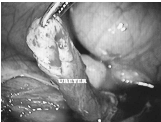
Figura 2. Espotulación ventral del uréter.

El procedimiento se inicia con la movilización del colon hacia medial y la identificación del uréter comprometido a la altura del cruce con los vasos ilíacos. Se disecciona el uréter sano lo más distal posible procurando no comprometer su irrigación, y se secciona. Obtenemos una muestra de uréter distal para biopsia contemporánea en el caso de tumor. El uréter enfermo se reseca sólo en caso que se considere necesario, de lo contrario se deja "in situ" . Luego de espatular el cabo ureteral sano, se disecciona la vejiga en su aspecto anterior (espacio de Retzius) en forma amplia. Se confecciona un flap de pared vesical en forma de trapecio cuya base está en la cúpula vesical y el ápice hacia el cuello. El flap se evierte y se sutura al extremo de uréter sano que se ha espatulado con una incisión en su aspecto ventral (Figura 2). La sutura se realiza con puntos separados de vicryl 4-0 comenzando en el aspecto posterior del flap de vejiga evertido (Figura 3). Luego se realiza el cierre de la vejiga con sutura corrida de vicryl 2-0 en continuidad con el neoureter que