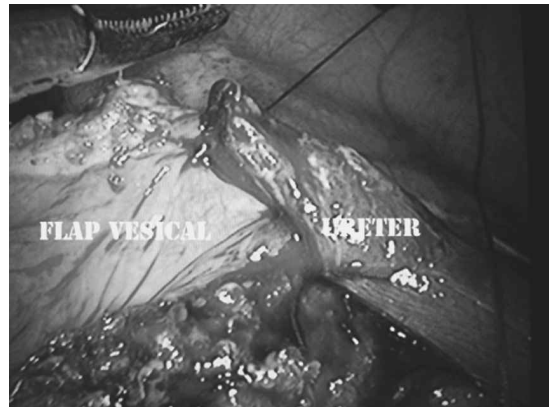
Figura 3. Anastomosis del uréter espatulado al flap vesical.

resulta de la tubularización del flap, sobre un catéter doble J (Figura 4). Dejamos un drenaje en proximidad a las líneas de sutura.