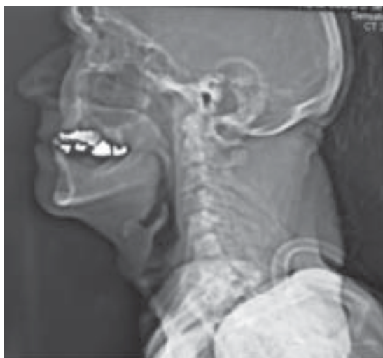
Figura 1. TC cervical sin contraste: reconstrucción sagital.

La TC (Figuras 1 y 2), mostró tumor cervical