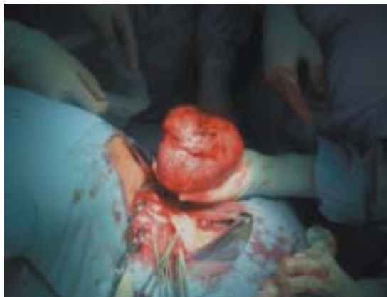
Figura 4. Tumor enucleado.

Evolucionó sin complicaciones. La biopsia diferida concluyó Fibromatosis extraabdominal (Tumor