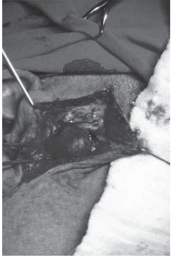
Figura 2. Imagen intraoperatoria del aneurisma.