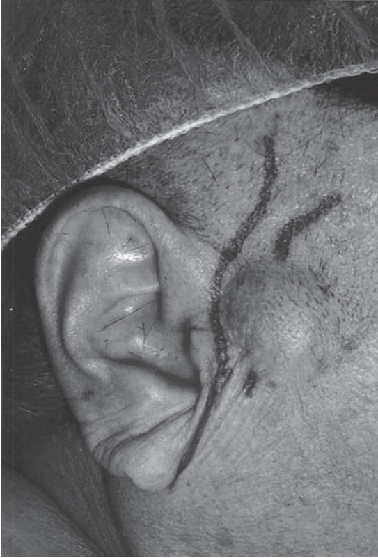
Figura 1. Aneurisma temporal antes de la operación.