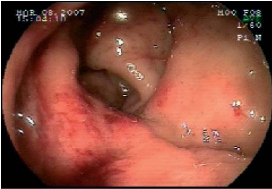
Figura 1. Colonoscopia.

inmunodeficiencia humana diagnosticado en Noviembre de 1999, que en Febrero del año 2007 consulta por dolor anal de meses de evolución y que se acentúa al defecar. A la inspección se identifica una fisura anal crónica en la comisura posterior. Al tacto rectal se palpa una masa circunferencial ubicado sobre el anillo anorrectal.