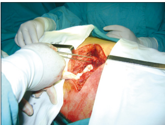
Figura 4. Lesión de los planos musculares.