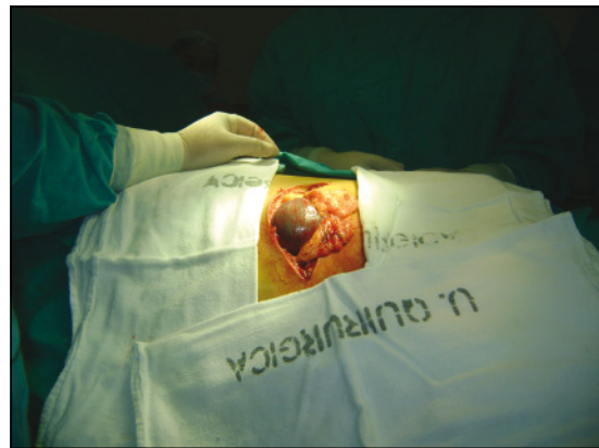
Figura 3. Aspecto tras la incisión.

El alto índice de sospecha, los exámenes confirmatorios adecuados y la oportuna resolución quirúrgica, con uso de prótesis para reforzar la pared abdominal, creemos, son una excelente alternativa para este tipo de escenario clínico.