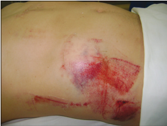
Figura 1. Aspecto de la lesión abdominal.