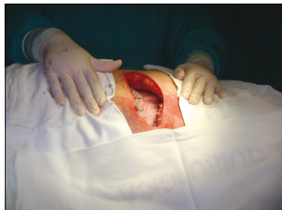
Figura 5. Reparación con malla de Prolene®.