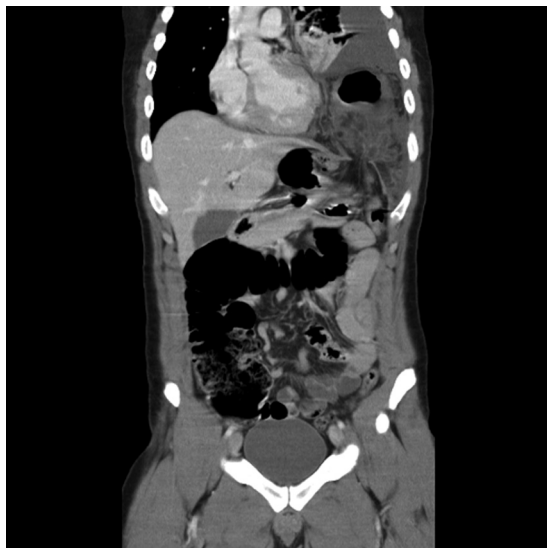
Figura 1. Reconstrucción coronal. Hernia diafragmática izquierda con ascenso de un segmento del colon transverso que muestra signos de isquemia de su pared y edema por congestión de su meso. Nótese la presencia de derrame pleural izquierdo y atelectasia del lóbulo inferior en forma asociada.

de peso de 5 kg. Tres días previos al ingreso presenta dolor epigástrico irradiado a dorso y a hemitórax izquierdo, vómitos postprandiales y disnea. Destaca una hemodinamia estable, dolor epigástrico asociado a MP izquierdo disminuido y RHA en hemitórax izquierdo. TC de abdomen: Hernia Diafragmática de Bochdalek con estómago deslizado parcialmente a la cavidad torácica y neumotórax significativo ipsi-