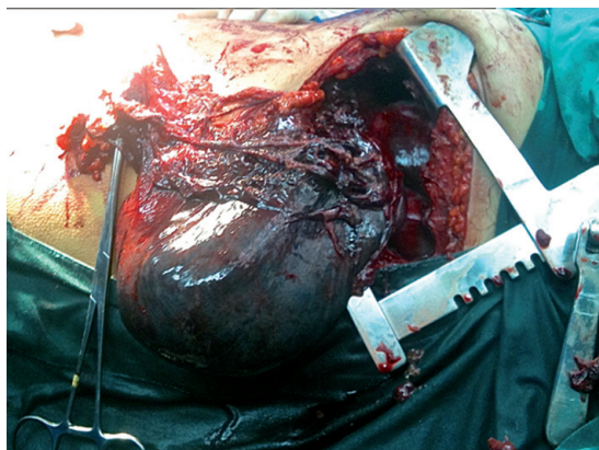
Figura 2. Imagen cirugía. Toracotomía posterolateral izquierda. Exposición de necrosis de ángulo esplénico del colon transverso.