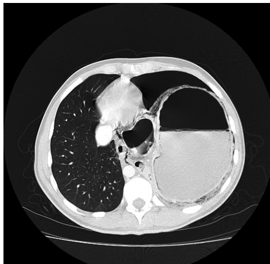
Figura 4. Imagen axial en ventana pulmonar. Se demuestra la herniación parcial del estómago a través del hemidiafragma izquierdo, con engrosamiento de su pared asociado a neumatosis e hidroneumotórax ipsilateral..

lateral (Figura 3 y 4). Con los hallazgos descritos se explora quirúrgicamente con una laparotomía media supraumbilical destacando un hemoperitoneo de aproximadamente 3.000 cc. Asimismo, un defecto diafragmático posterolateral izquierdo de 8 cm por el cual se hernia cuerpo y fondo gástrico, encontrándose este necrótico y perforado. Se realiza lavado profuso de cavidades pleural y peritoneal, se realiza una gastrectomía parcial del área necrótica y cierre del defecto diafragmático con puntos de Ethibond ® . Se dejan dos drenajes pleurales. Paciente evoluciona muy grave en UCI pese a soporte avanzado y tratamiento antibiótico. TC de tórax de control muestra colección loculada pleural izquierda la cual se resuelve por VATS satisfactoriamente. Evoluciona en buenas condiciones generales y es dado de alta luego de completar terapia antibiótica prolongada.