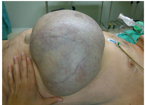
Figura 1. Aspecto en el preoperatorio.

Posiblemente el esfuerzo emético aumentó la presión sobre un área debilitada y fija por la constricción continuada del anillo herniario, favoreciendo la perforación gástrica.