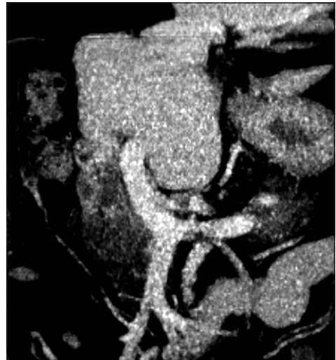
Figura 2. Proyección de máxima intensidad de tomografía computada. Vena porta sin ramificación derecha, se continua como estructura única a vena porta izquierda.

Se tomó una Tomografía Computada (TC) donde se describe sólo el lóbulo hepático izquierdo, sin identificar hígado derecho, ni venas hepáticas derechas; tampoco se describe vesícula biliar (Figuras 1 y 2). Se realiza Colangio Resonancia Nuclear Mag-