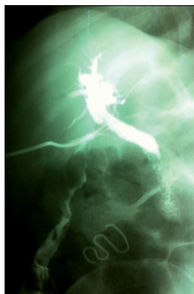
Figura 1. Colangiografía intraoperatoria en la que se evidencia una imagen opaca en forma de espiral, asemejándose a un DIU localizado en flanco derecho del abdomen.

La perforación uterina es una de las complicaciones de la inserción de un DIU, con una incidencia de 1,3 a 1,6 por 1.000 1 . La migración de este a la cavidad pélvica o abdominal puede causar complicaciones importantes como infecciones del tracto urinario, dolor abdominal crónico, formación de cálculos alrededor del DIU, gangrena del intestino delgado, obstrucciones o fístulas ureterovesicales 1,2 . La perforación del útero por un DIU puede ser causada al momento de la inserción o cuando éste es colocado durante el puerperio, otros factores relacionados a este fenómeno son el tamaño y posición uterina, anomalías congénitas y cirugías previas 1 . Si bien es extremadamente rara la migración asintomática de DIU, se han reportado casos previos 3,4 ; respecto al tratamiento, actualmente no existe un consenso si los DIU migrados asintomáticos requieren ser retirados quirúrgicamente 4 .