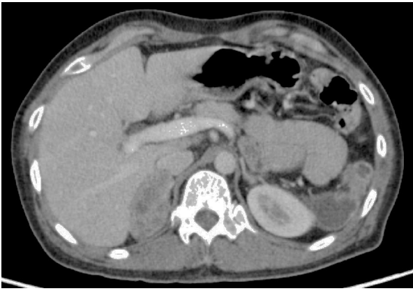
TC. Tumor en la glándula suprarrenal derecha.