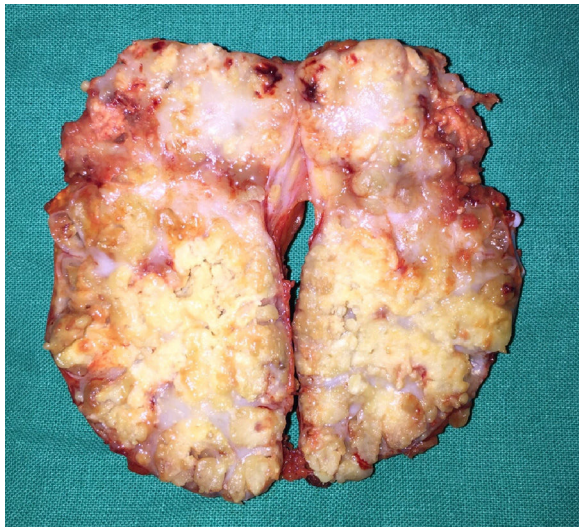
Aspecto macroscópico de la lesión suprarrenal derecha.