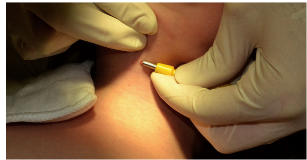
Figura 3 Extirpación de molusco contagioso mediante punch de 3 mm.

La reparación del lóbulo auricular con rotura traumática parcial, en la que se genera un canal revestido de piel en el espesor del lóbulo, puede realizarse mediante la técnica del