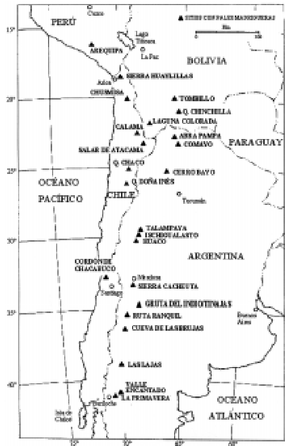
Fig. 1: Localización geográfica de zonas en las que se ha registrado la existencia de paleomadrigueras en Sudamérica.

Los roedores del género Neotoma poseen atributos particulares que favorecen la formación de paleomadrigueras. Son animales terrestres,