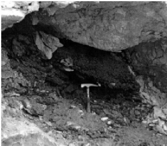
Fig. 4: Paleomadriguera de Lagidium dentro de cueva de caliza en localidad de Las Lajas, Provincia de Neuquén, Argentina. Este depósito también contiene fecas de un perezoso extinto. Las fecas de Lagidium fueron fechadas en 13.750 \pm 230 , y las del perezoso en 13.730 \pm 1.070 y 14.665 \pm 150 años AP.

Cerca de Bariloche, se están estudiando paleomadrigueras a lo largo de un transecto Este-Oeste de 250 km, que abarca la transición entre el bosque de Nothofagus y la estepa patagónica. Este es uno de los gradientes ambientales más interesante entre las zonas áridas de Sudamérica: a pesar de pequeñas diferencias en elevación (1.200 a 900 m), la lluvia decae dramáticamente desde más de 1.000 a 200 mm en una escasa longitud de 250 km. En particular, interesa conocer la estabilidad a largo plazo del ecotono bosque-estepa, en relación al uso de la tierra, fuego y clima (Markgraf et al. 1997). Particular interés presenta la transición bosque patagónico/estepa cerca del Valle Encantado/La Primavera y Las Lajas, así como el Desierto del Monte cerca de la Gruta del Indio. Si los alisios hubiesen estado desplazados hacia el norte durante el último período glacial, entonces taxa sureños como Austrocedrus , Araucaria y Nothofagus podrían haberse expandido hacia el norte junto a tormentas y condiciones de temperatura más baja, durante la época de crecimiento. Macrofósiles de estos taxa deberían entonces estar presentes en la superficie de paleomadrigueras Pleistocénicas en estas áreas. Desafortunadamente, hasta ahora sólo se ha encontrado una paleomadriguera con esa