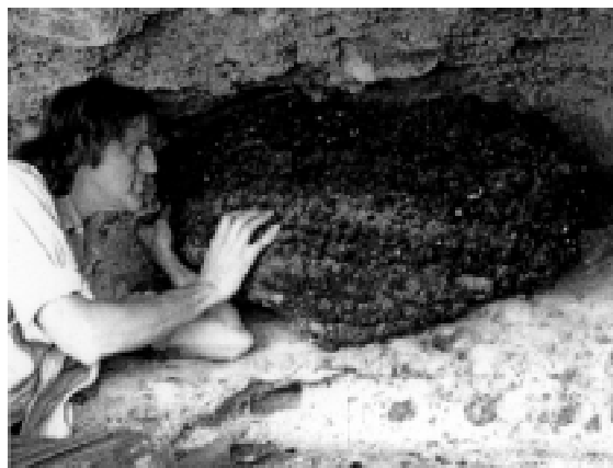
Fig. 2: Paleomadriguera hecha por Neotoma en el desierto de Mojave, al sur del estado de Nevada, Estados Unidos. Este depósito fue fechado en 12.000 años AP. Se muestra al paleoecólogo Paul Martin como escala.

El número de géneros y especies que participan en la formación de paleomadrigueras podría aumentar, luego que se conozca con más detalle la biología e historia natural de las especies de roe-