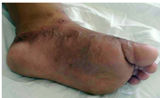
Figura 3. Compromiso de plantas por placas urticariales con borde vesiculoso en paciente con penfigoide gestacional.

La biopsia de piel mostró ortoqueratosis, espongirosis y esbozo de ampolla subepidérmica no acantolítica con numerosos eosinófilos. Dermis con edema papilar e infiltrado linfocitario, perivascular, superficial y profundo, con granulocitos eosinófilos. Anexos conservados. No se observó ni vasculitis ni granulomas (Figura 4). A la inmunofluorescencia directa (IFD) se observó depósito de C3 lineal, en membrana basal (Figura 5). Negativo para IgA, IgG, IgM o fibrina. Estos hallazgos son compatibles con PG.