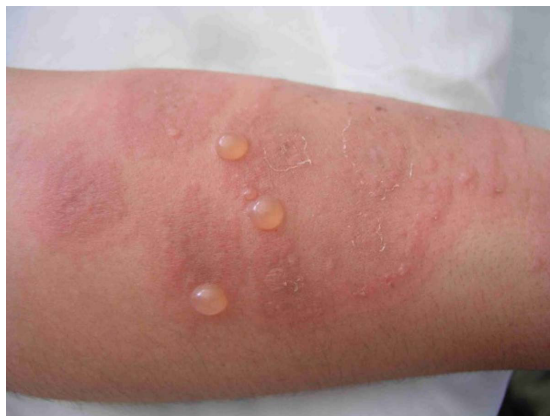
Figura 1. Vesículas y bulas de contenido seroso sobre placas urticariales eritematosas en paciente con penfigoide gestacional.