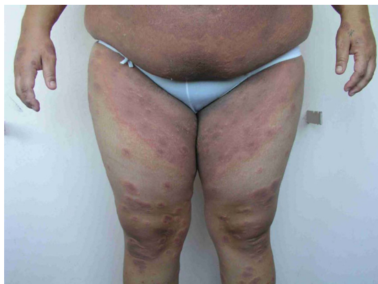
Figura 2. Eritema generalizado de abdomen y muslos por confluencia de placas urticariales en paciente con penfigoide gestacional.