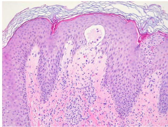
Figura 4. Ortoqueratosis, espongirosis y esbozo de ampolla subepidérmica no acantolítica con numerosos eosinófilos.

Se controló a las 36+1 semanas de edad gestacional, con buena respuesta al tratamiento, y con lesiones principalmente costrosas en caras extensoras de extremidades, tronco y abdomen. Sin prurito, ni aparición de nuevas lesiones. Se mantuvo terapia corticoesteroidal. A las 37 semanas la paciente