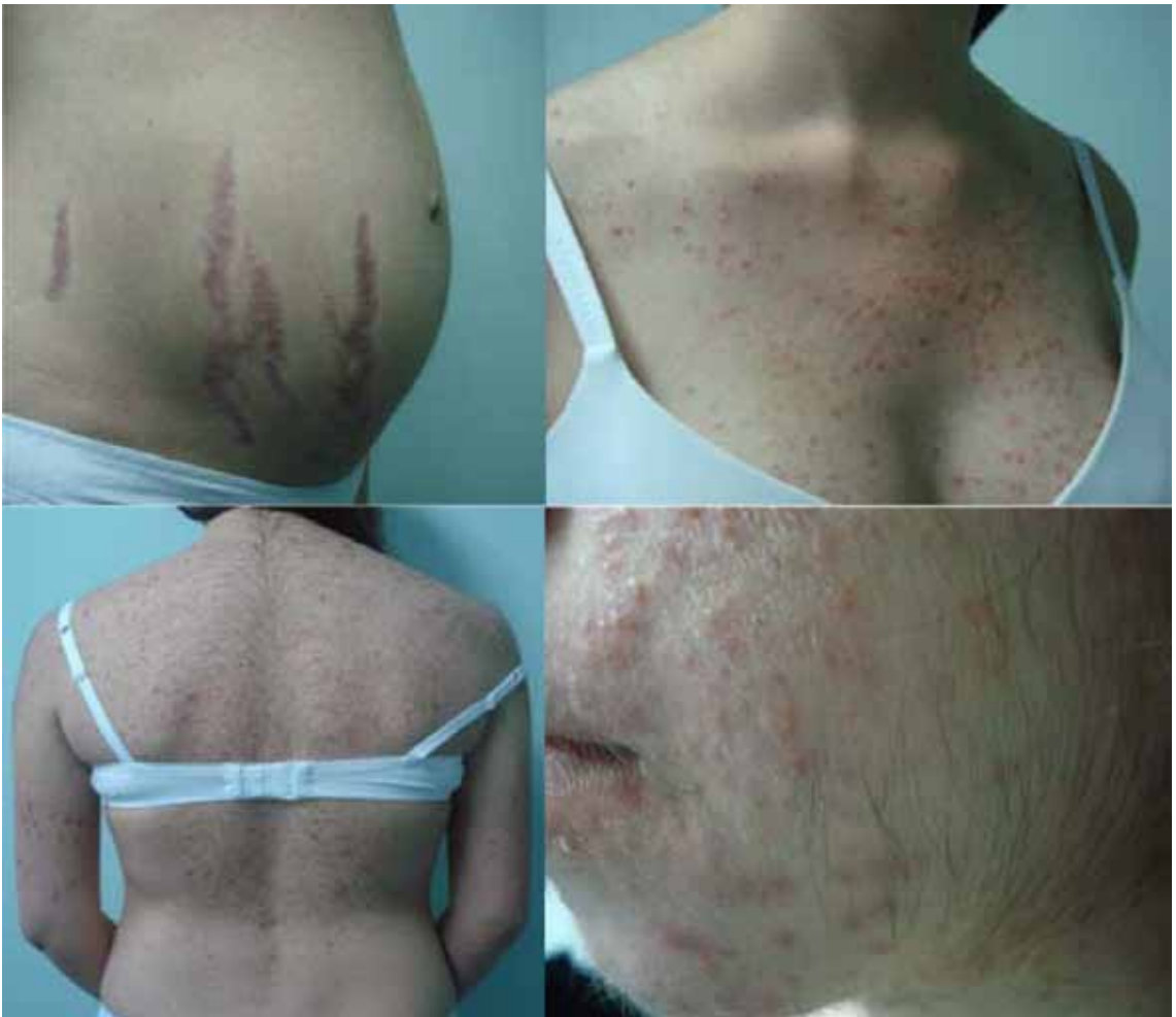
Figura 1. Abdomen gravídico con estrías violáceas gruesas, pápulo-pústulas monomorfas en pecho, espalda e hirsutismo en cara.