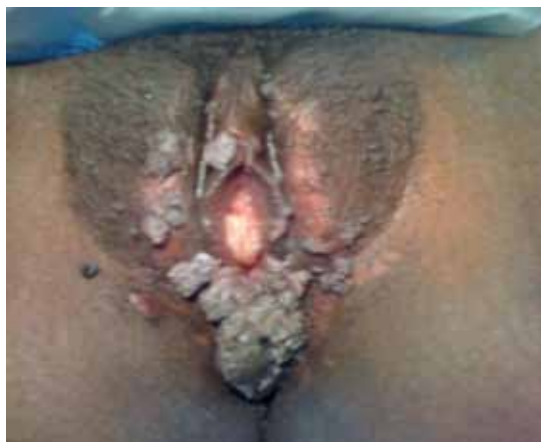
Figura 1. Condilomatosis severa anogenital.

Según la International Council on The Taxonomy of Viruses clasifica los genotipos 6 y 11 dentro del género Alfa-Papillomavirus y están implicados además en la producción de los condilomas acuminados y papilomas del cuello uterino (Figuras 1 y 2) y de la laringe (20).