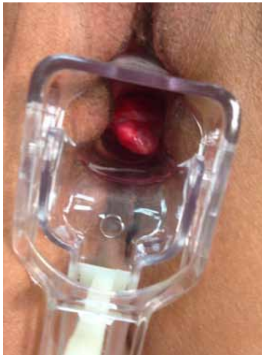
Figura 1. Lesión exofítica lisa, indurada y sangrante al roce de aproximadamente 5 cm que ocupa al tacto toda la vagina y asoma por introito.

posterior. A la exploración se aprecian genitales externos normales, vagina con efectos de radioterapia, leucorrea inespecífica con restos hemáticos escasos y lesión exofítica lisa, indurada y sangrante al roce, de aproximadamente 5 cm que asoma por introito (Figura 1). Al tacto vaginal, ocupa toda la vagina. Se piensa en diagnóstico diferencial de granuloma de cicatriz o recidiva tumoral por lo que se toma citología con resultado de atrofia y biopsia con resultado de tejido reactivo y necrosado (Figura 2). Ante este resultado se cita a la paciente para informarle y se decide programar exploración bajo anestesia en quirófano con ampliación de muestra de biopsia en dos semanas. En quirófano con la paciente anestesiada se objetiva una lesión exofítica de menor tamaño (2 x 1 cm), de aspecto graso, polipoide, friable y sangrante al roce, que parece corresponder a apéndice epiploico. Al traccionar con pinza de Foerster se produce salida de epiplón y asas intestinales de delgado, ampliándose espontáneamente lo que era un defecto en cúpula vaginal de 1 cm hasta 3 cm. Se comprobó la viabilidad de las asas intestinales, se realizó lavado de las mismas con suero fisiológico y se procedió a su introducción a través de la cúpula vaginal abierta.