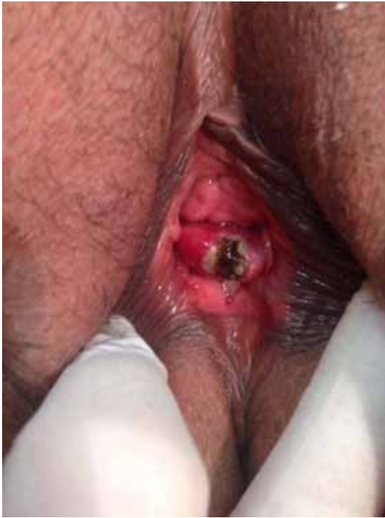
Figura 2. Imagen de la lesión tras realizar biopsia con pinza sacabocados y coagulación con nitrato de plata.