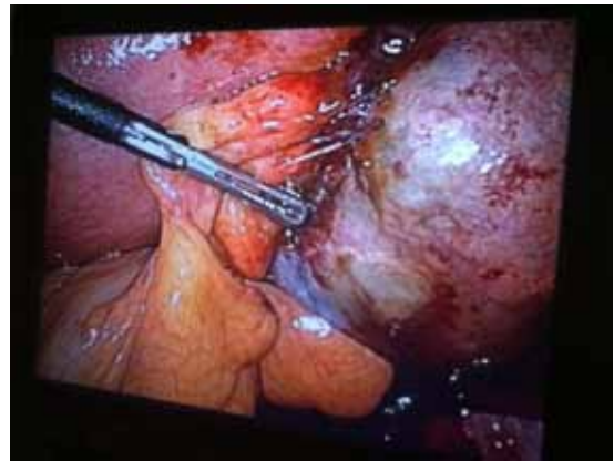
Figura 1. Caso 1: Útero gestante a la izquierda de la imagen y adherido a éste conglomerado en zona anexial derecha de 11 cm.

Se visualiza hemoperitoneo escaso, útero aumentado de tamaño acorde a la edad gestacional y conglomerado de trompa y ovario derecho de unos 8 x 11 cm, adherido a recto y cara posterior uterina, apreciándose hematoma organizado sin poderse precisar origen en trompa o en ovario. Tras adhesiolisis cuidadosa se realiza salpingectomía derecha y drenaje del hematoma. En ecografía de control se comprueba viabilidad fetal y se objetiva imagen compatible con coágulo organizado de 5 cm adyacente a ovario derecho. El informe de Anatomía Patológica indica la presencia de vellosidades trofoblásticas en el material remitido, lo que confirma el diagnóstico de gestación heterotópica (Figura 1 y 2).