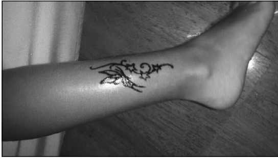
Figura 1. Imagen proporcionada por la madre de la paciente, donde se observa el tatuaje original de henna negra.

contacto causada por reacción de hipersensibilidad tipo IV, posiblemente asociada a la PPD de la henna negra.