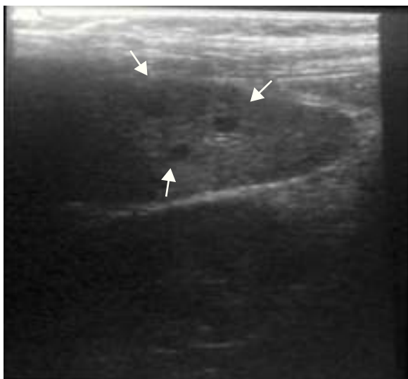
Figura 1 Ecotomografía de bazo con lesiones hipocogénicas de aproximadamente 4 mm sugerentes de abscesos.

Clínico Universidad Católica). Dentro del estudio de imagen del paciente destacaba una radiografía de tórax sin lesiones, ecotomografía abdominal que evidencia múltiples lesiones hipocogénicas de aproximadamente 4 mm en el bazo, sugerentes de microabscesos (fig. 1) e hígado con ecoestructura sin alteraciones. Basándonos en lo anterior se inicia tratamiento con claritromicina oral en dosis de 15 mg/kg/peso cada 12 h para tratamiento de EAG.