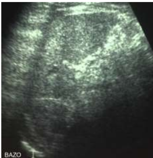
Figura 3 Bazo de forma, tamaño y ecoestructura normal. Sin lesiones hipocogénicas.

de sospecha, por lo que muchas veces este se identifica de forma tardía o se confirma luego de múltiples tratamientos sin respuesta. Dentro de estas formas atípicas, una forma frecuente de presentación es como un síndrome febril prolongado, como se presentó nuestro caso clínico, logrando establecerse el diagnóstico final basado en el cuadro clínico, la serología y el estudio imagenológico.