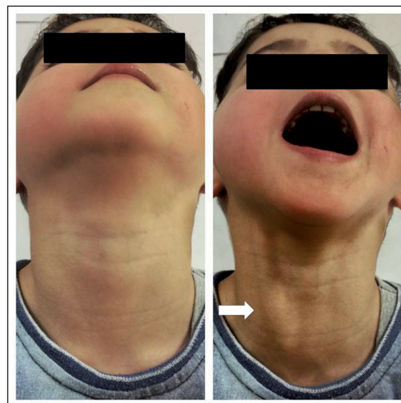
Figura 1. Exploración física del paciente en reposo y realizando una maniobra de Valsalva, donde se visualiza el aumento de volumen cervical (flecha).

Niño de 5 años derivado a la consulta de Cirugía Pediátrica por presentar una masa cervical, de manera intermitente, apreciada por su familia desde hace unos meses. No constan antecedentes médico-quirúrgicos de interés. El paciente se encontraba asintomático. Al explorarlo, no se objetivó ninguna tumoración cervical, que sí se hizo evidente, al realizar maniobras de Valsalva (figura 1). Se le solicitó una ecografía (figura 2) y angio-RMN para completar el estudio (figura 3). Se concluyó que se trataba de una flebectasia de la vena yugular externa. Dado que el paciente está asintomático, el manejo es conservador, y tan sólo si aparecieran síntomas se plantearía el tratamiento quirúrgico.