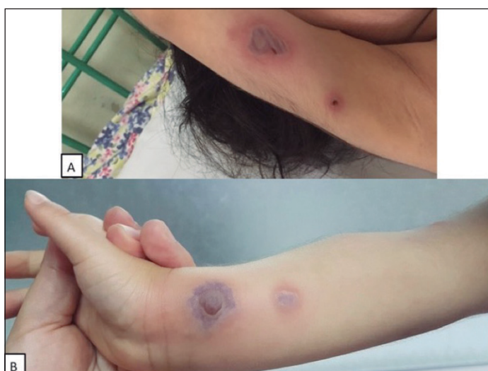
Figura 2. Imagen clínica. Ampollas en extremidad superior derecha A: Ampolla de contenido hemorrágico, base eritematosa de 2 cm diametro en cara interna de brazo derecho. B: Ampolla tensa de contenido hemorrágico, violácea de 2,5 cm diametro en antebrazo derecho.