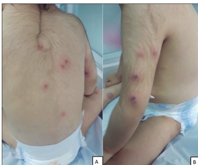
Figura 1. Imagen clínica. A: Ampollas y úlceras costrosas en región dorsolumbar. B: Ampollas y úlceras costrosas en brazo izquierdo.

El SS en pediatría es una condición muy infrecuente. Se ha descrito una distribución equitativa por género, pero con un leve predominio en el género masculino en los menores de 3 años (6) . La edad promedio de diagnóstico en los casos pediátricos corresponde a 5 años (6) . Las lesiones cutáneas son típicamente sensibles y se presentan como nódulos o pápulas rojas o violáceas, pudiendo desarrollar lesiones tipo placas y en ocasiones lesiones ampollares. Normalmente se distribuyen de forma asimétrica y curan sin dejar ci-