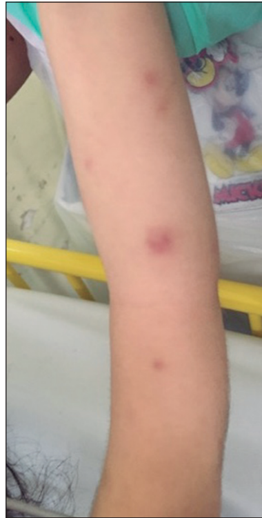
Figura 3. Imagen clínica. Pápulas y nodulos eritematosos en brazo y antebrazo izquierdo.

catriz. Pueden ser precedidas por varios días a semanas de fiebre (7) . Los síntomas y/o signos comúnmente asociados corresponden a artritis, mialgias y compromiso del estado general (3) . Los hallazgos de laboratorio más frecuentes corresponden a neutrofilia y VHS elevada, por lo que muchas veces el diagnóstico se ve retrasado, al confundirse con un cuadro infeccioso (7,8) . Dentro de los criterios diagnósticos propuestos, en la histopatología destaca la presencia de infiltrado neutrofílico en la dermis, sin vasculitis leucocitaria clásica (5) . Este infiltrado se extiende a menudo a lo largo de toda la