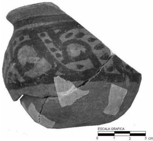
Figura 2. Cerámica Coyotlatelco.