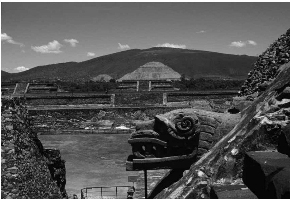
Figura 1. Pirámides del Sol y de la Luna desde el Templo de la Serpiente Emplumada.

Sin duda alguna Teotihuacan reproduce un modelo cósmico del mundo del altiplano mesoamericano a fines del preclásico superior y principios del clásico. Es posible que nos sea muy complicado saber la causa exacta del origen de la ciudad, pero las sucesivas investigaciones llevadas a cabo en Teotihuacan, Cuicuilco y más recientemente en el valle poblano-tlaxcalteca nos muestra que la movilidad de las poblaciones del altiplano fueron determinantes para la constitución de la urbe (Carballo, 2009; Carballo y Pluckhahn, 2007). Hay diversos factores involucrados como serán los movimientos volcánicos y tectónicos de fines del preclásico, el desarrollo cultural de dichas poblaciones, el cambio de las redes de intercambio y la propia disposición de la futura ciudad, cuyo valle posiblemente sea reinventado bajo una particular cosmovisión. Podría ser algo arriesgado afirmar que el surgimiento de Teotihuacan es consecuencia exclusiva de factores externos al propio valle, ya que