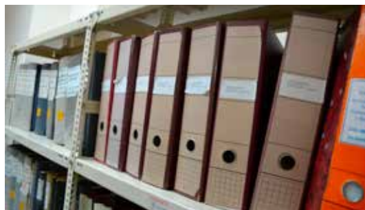
Foto 1. Archivo Pampa Escrita en el Archivo Regional de Tarapacá (DIBAM).

En cuanto a su contenido, y tal como veníamos señalando, estas cartas se caracterizan por lo fragmentario de la información contenida, no solo porque abordan las más diversas dimensiones de la actividad humana desplegada sobre la pampa salitrera, sino que por su carácter privado, ellas carecen de todo esfuerzo de contextualización. A diferencia de