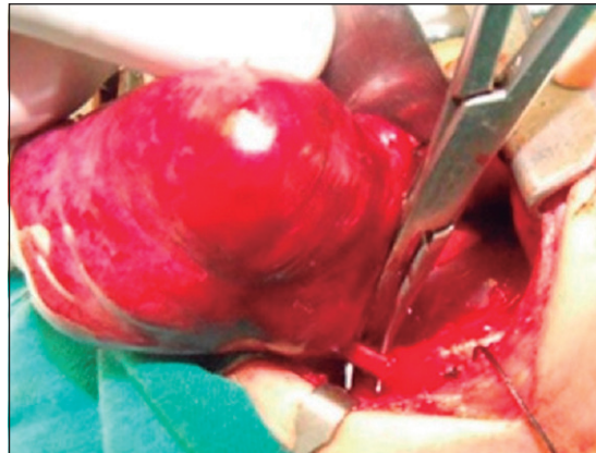
Figura 2. Exteriorización del secuestro pulmonar con su arteria nutricia.

Al corte mostró un aspecto esponjoso con áreas rojizas y pequeñas dilataciones. El examen histopatológico reportó tejido pulmonar constituido por bronquios y bronquiolos inmaduros con pared de músculo liso y tejido elástico revestido por epitelio cilíndrico ciliado, algunos bronquios y bronquiolos con dilatación microquistica, congestión vascular y hemorragia intersticial (Figura 4).