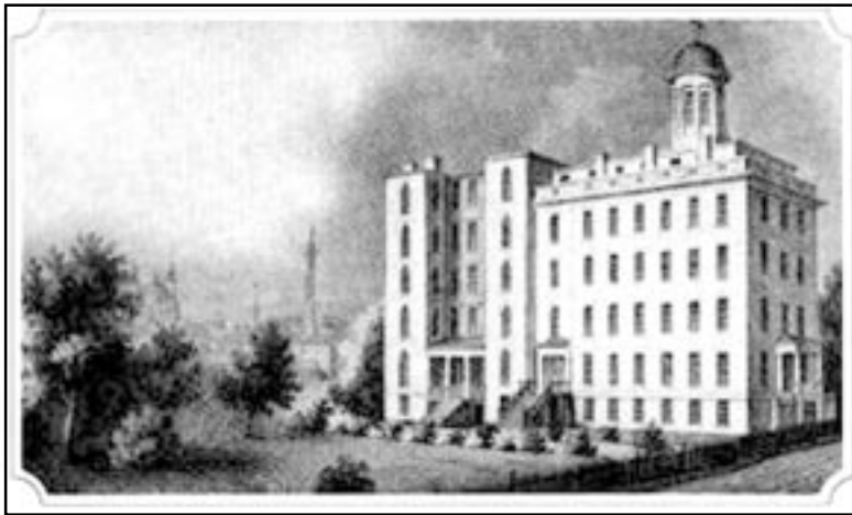
Figura 3. El Hospital Washington de Baltimore donde falleció Poe 6 .

to de sus caídas y que ésta haya originado una reagudización de sus crisis parciales complejas llevando a un status parcial complejo, condición que tiene una alta mortalidad per se . Su condición de abuso de alcohol impresiona tener como base un trastorno del ánimo; cada vez que Poe sufría alguna decepción recurría al alcohol como medio de superar el problema. Existe evidencia que tanto el trastorno bipolar como la depresión mayor conllevan 60% y 25% de comorbilidad con abuso de drogas y alcohol, respectivamente 12 .