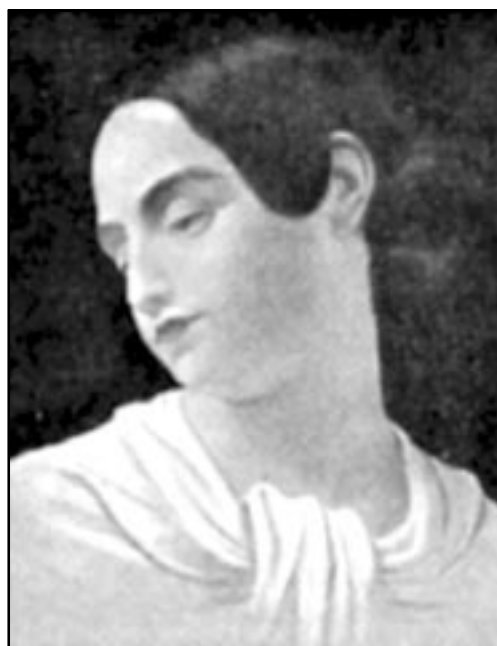
Figura 2. Virginia Clemm, esposa de Poe 6 .

Logró vivir años felices junto a su esposa, pero ésta contrajo tuberculosis y falleció precozmente a los 24 años en 1847, lo que originó un nuevo período depresivo a Poe, quien se refugió en el alcohol y opio 3,4,6 . Luego de algunos meses, logró enamorarse y mantuvo tormentosas relaciones con Sara Whitmann y luego Ana Heywood, a las que se declaró simultáneamente 3,4 .