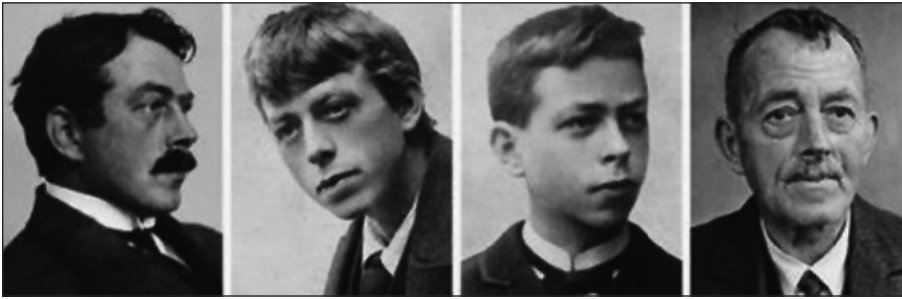
Figura 2. Robert Walser a distintas edades, la última foto de la izquierda ya es de su último año de vida 13 .

En su familia existían varios casos de trastornos mentales: su madre, depresiva, y dos de sus hermanos con esquizofrenia, uno de los cuales se suicidó 5 .