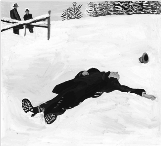
Figura 3. Dramática fotografía del hallazgo de Walser muerto en uno de sus incontables paseos, el día de Navidad de 1956 13 .

sus incontables caminatas diarias, en la Navidad del año 1956, en Suiza cerca del sanatorio de Herisau (Figura 3). Fue encontrado por unos niños. Curiosamente, Walser parece haber anticipado su muerte en la descripción que hace del fallecimiento del protagonista de la novela "Los Hermanos Tanner" 9 . En ella Sebastián, un poeta, es encontrado muerto en la nieve bajo un cielo constelado. Quién lo encuentra es Simón su hermano, cuyas palabras parecen una autoelegía anticipada: "con que nobleza ha elegido su tumba. Yace en medio de espléndidos abetos verdes, cubiertos por la nieve. No quiero avisar a nadie. La naturaleza se inclina a contemplar a su muerto, las estrellas cantan dulcemente en torno a su cabeza y las aves nocturnas graznan. Es la mejor música para alguien que no tiene oído ni sensaciones".