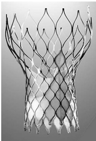
Figura 1. Prótesis Medtronic CoreValve TM .

ausencia de mejoría clínica significativa 6 . Por ello, la valvuloplastia con balón es hoy considerada sólo como una opción de emergencia y como puente hacia la cirugía o el implante valvular aórtico transcatóter (TAVI). Esta nueva técnica, inicialmente descrita por Andersen 7 , fue introducida en el año 2008 por Cribier, en pacientes mayores y de alto riesgo quirúrgico, con estenosis aórtica severa sintomática 8 . Las primeras series de centros únicos demostraron la viabilidad y eficacia de la prótesis balón-expansible Sapien Edwards TM (Edwards Lifesciences LLC, Irvine, CA, USA) 9 , así como de la válvula auto-expansible CoreValve TM (Figura 1), ahora Medtronic CoreValve TM (Medtronic CoreValve, Irvine, CA, USA) 10-12 . Esto fue confirmado por un gran registro multicéntrico de la CoreValve de Medtronic 13 . Los promisorios resultados a nivel