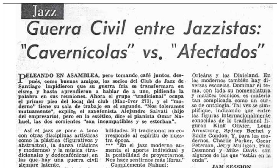
Foto 4. Recorte de nota de prensa publicada el 1 de marzo de 1961, p. 28, en una revista no identificada.

La crisis interna incluso fue ventilada por la prensa escrita, consignándose la opinión de los tradicionalistas quienes consideraban que el moderno “no es jazz” y que calificaban sus cultores como “afectados y siúuticos”. Del mismo modo quedó establecida la opinión de los modernistas, quienes calificaban a los tradicionalistas de “cavernícolas y retrógrados”.