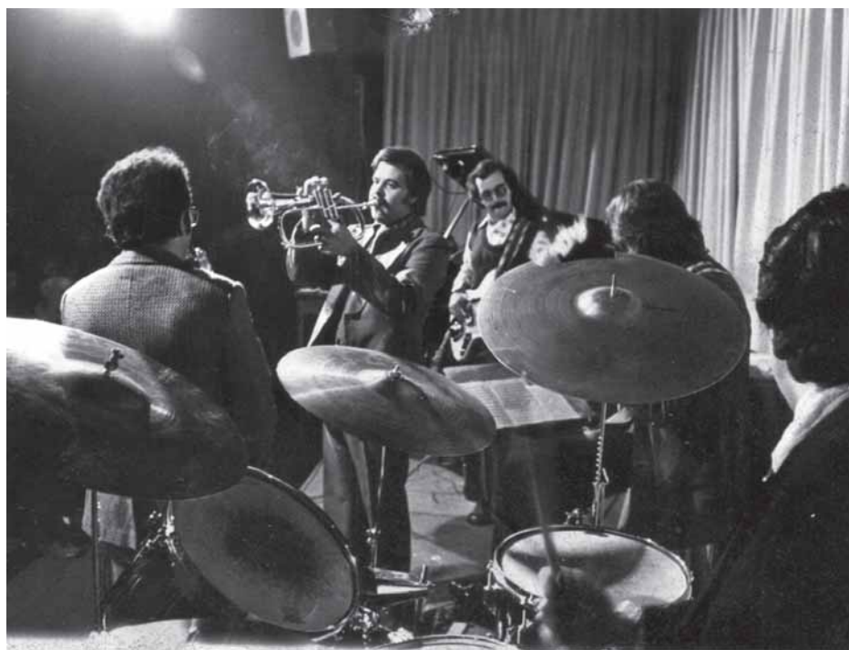
Foto 6. El grupo Fusión, 1974.