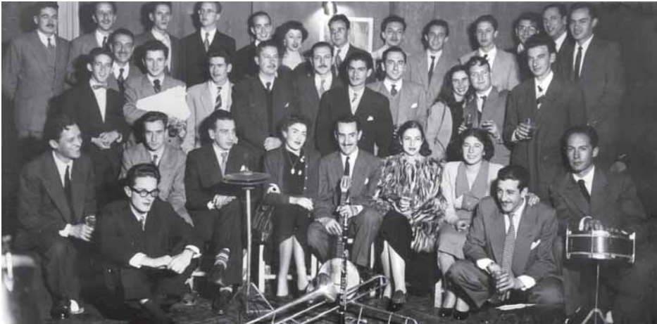
Foto 3. Miembros del Club de Jazz de Santiago, 1952.