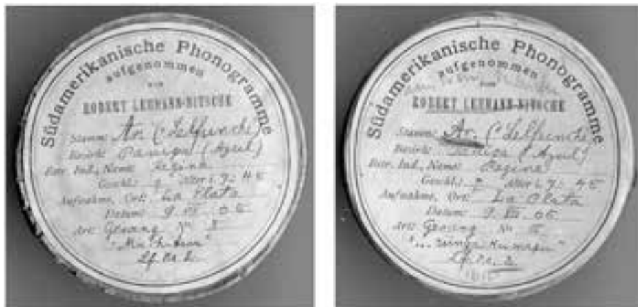
Imagen 2: Detalle de los cilindros 2 y 3 grabados a Regina el año 1905 y conservados en el Museo Etnológico de Berlín.