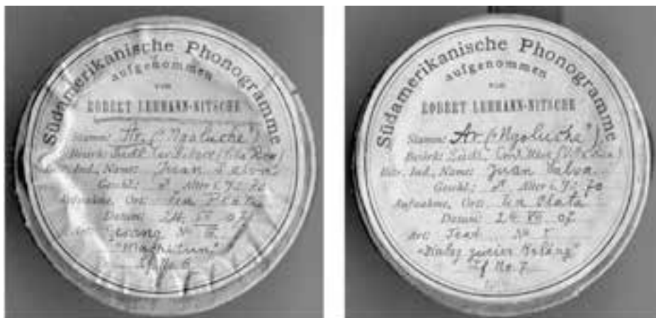
Imagen 3: Detalle de los cilindros 6 y 7, grabados a Juan Salva el año 1907 y conservados en el Museo Etnológico de Berlín.