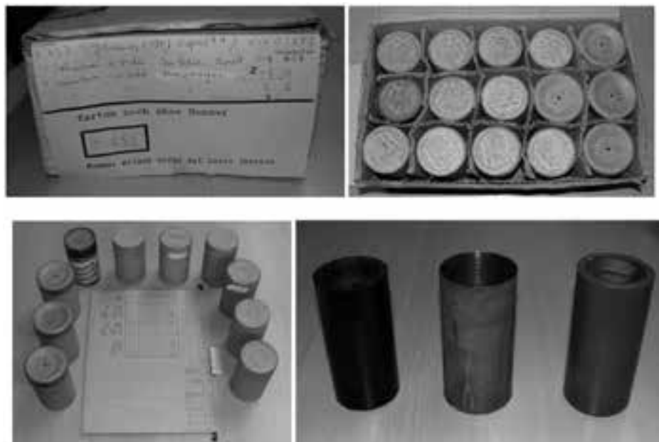
Imagen 1: Colección “Araukaner”, cilindros de cera conservados en el Museo Etnológico de Berlín.

8 pistas que hemos agregado como CD adjunto al libro Historia y conocimiento oral mapuche 32 . Estas grabaciones tienen las siguientes características 33 :